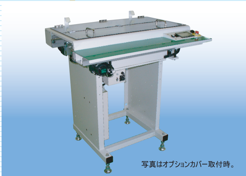
写真はオプションカバー取付時。